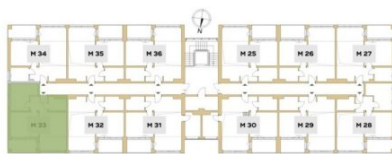
Rzut piętra budynku z lokalizacją mieszkania.