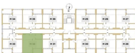
Rzut piętra budynku z lokalizacją mieszkania.