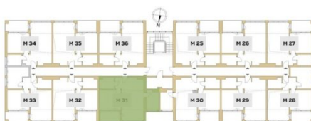
Rzut piętra budynku z lokalizacją mieszkania.