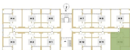
Rzut piętra budynku z lokalizacją mieszkania.