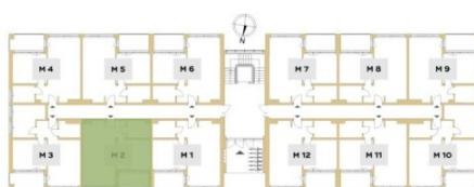
Rzut piętra budynku z lokalizacją mieszkania.